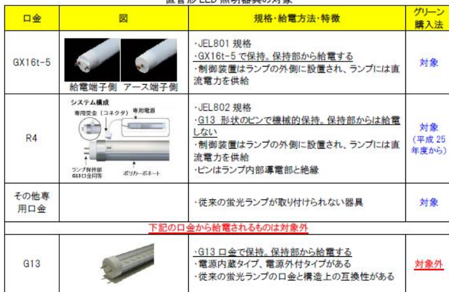
直管形 LED 照明器具の対象

対象外となる照明器具の口金の種類は、 G13 口金をはじめ、G5、RX17d、R17d、G10q、GX-10q、GX10q-5、GX24q、GY10q 等の従来型口金 となります。なお、JEL801 及び JEL802 規格に対応した口金付ランプを装着するための照明器具（GX16t-5 や R4）については対象となります。